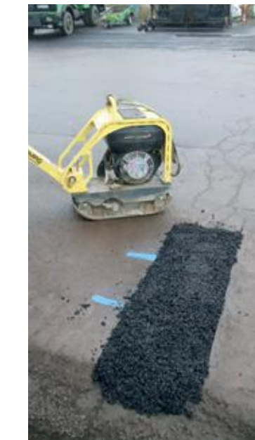
Grandes surfaces à l'aide d'une plaque vibrante

macphalt est polyvalent et utilisable sur un grand nombre de surfaces variées. Vous trouvez ci-dessous quelques exemples où macphalt a fait ses preuves: