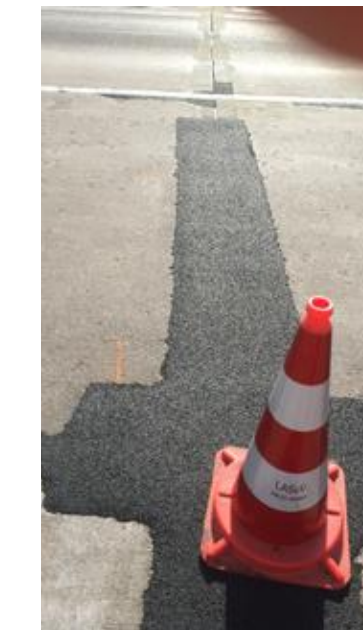
Travaux de restauration de voirie en béton (autoroutes)