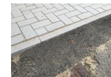
Rampes et travaux de finition en enrobé