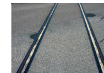
Le long de rails, entre autres de tramways