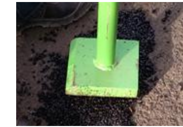
Petites surfaces à l'aide d'une dameuse