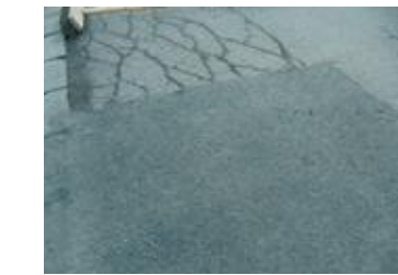
Réparation d'urgence (VRD)