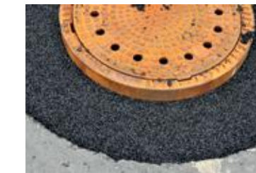
Remise à niveau de plaque d'égoûts